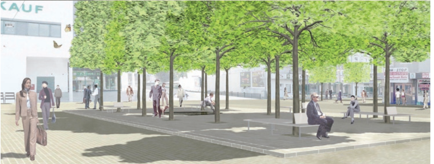
Blick auf Hauptstraße, Grüne Ladenstraße (oben) und Bahnhofsvorplatz bei Tag (unten)